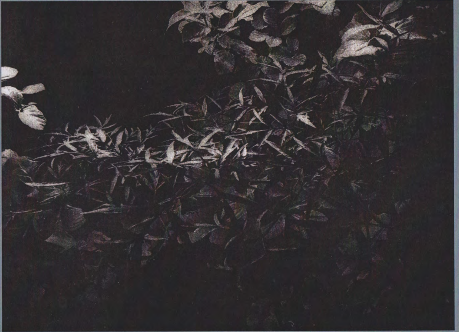
Seeming Nature I