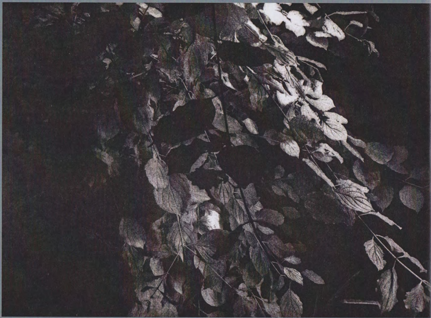
Seeming Nature II