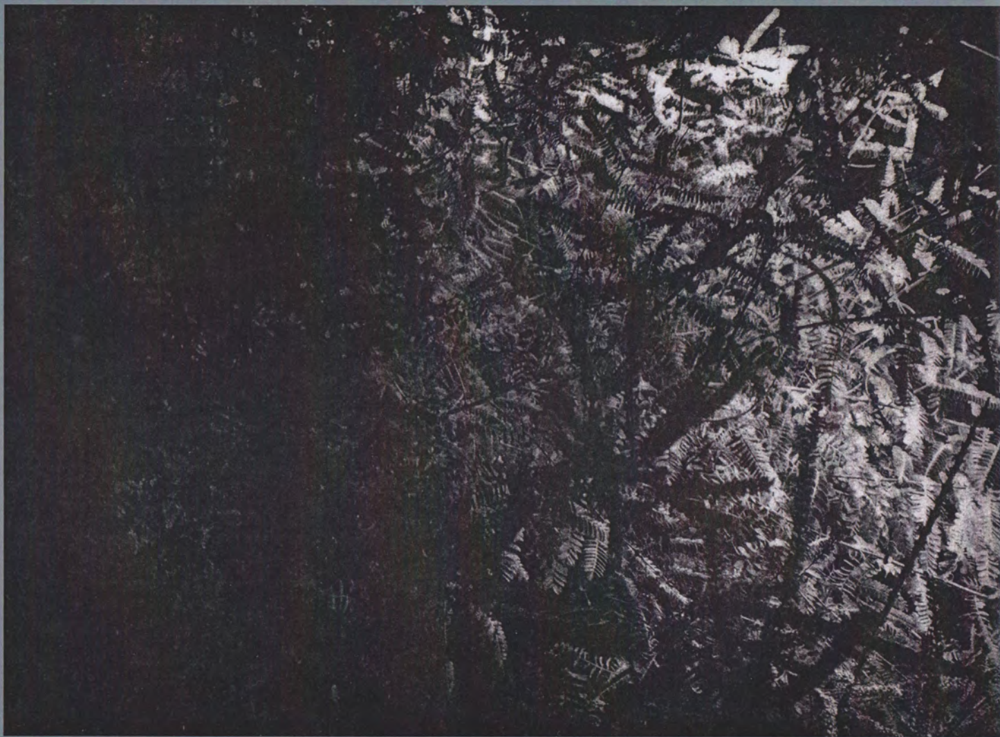
High Line Specimen