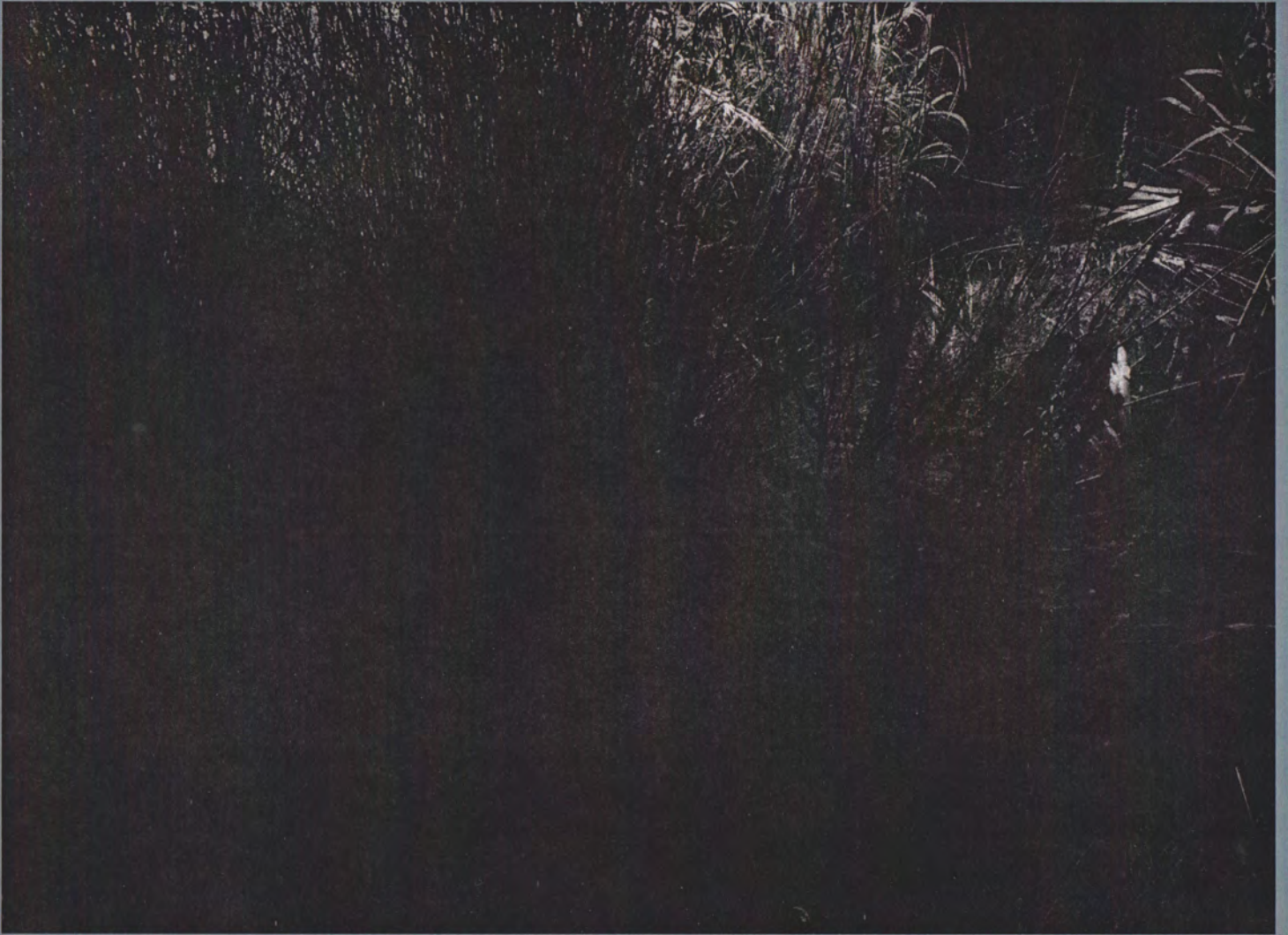
Vistas and Vantage Points