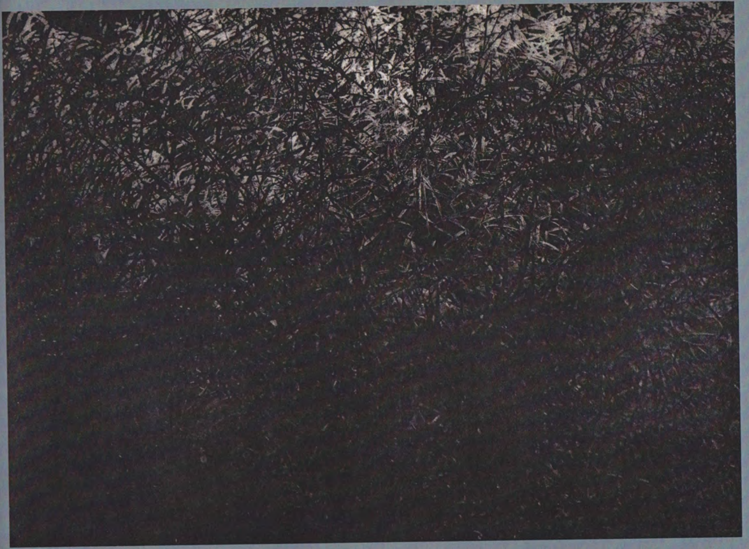
In Search of Wildness